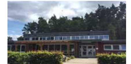
Sporthalle/Sportplatz Pattensen Hirtenbrink 59 21423 Winsen (Luhe)