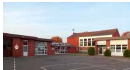
Dorfgemeinschaftshaus/Turnhalle Borstel Turnhallenweg 6, 21423 Winsen (Luhe)