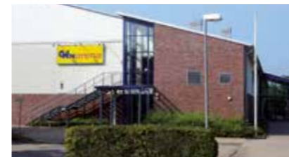
Sporthalle WinArena Bürgerweide 7a 21423 Winsen (Luhe)