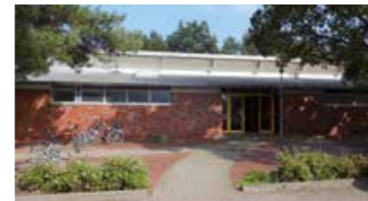
Sporthalle Wolfgang-Borchert-Schule Bürgerweide 16 21423 Winsen (Luhe)