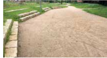
Boule-Platz „Winsener Wiesen“ Astrid-Lindgren-Straße 21423 Winsen (Luhe)