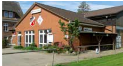
Sporthalle/Sportplatz Hooppte Hooppter Sportplatz 2 21423 Winsen (Luhe)