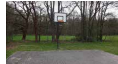
Streetballplatz Nedderfeldweg 21423 Winsen (Luhe)