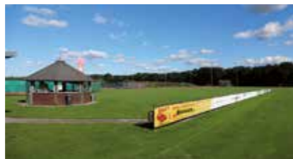
Sportplatz Borstel Heidlandsweg 100 21423 Winsen (Luhe)