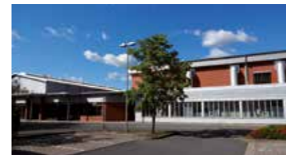
Sporthalle IGS, Sporthalle/Sportplatz Luhe-Gymnasium Rämenweg 5, 21423 Winsen (Luhe)