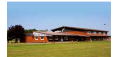
Sporthalle/Sportplatz Rottorf Roddauweg 17 21423 Winsen (Luhe)