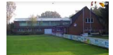
Sporthalle/Sportplatz Scharmbeck Am Sportplatz 4 21423 Winsen (Luhe)