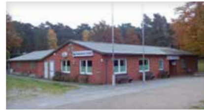
Schützenhaus Luhdorf Luhdorfer Waldweg 14 21423 Winsen (Luhe)