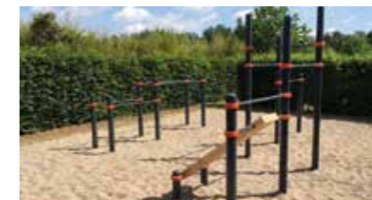
Street-Workout-Park Eckermannpark 21423 Winsen (Luhe)