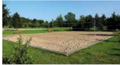
Beachvolleyballplatz „Eckermannpark“ Eckermannpark 21423 Winsen (Luhe)