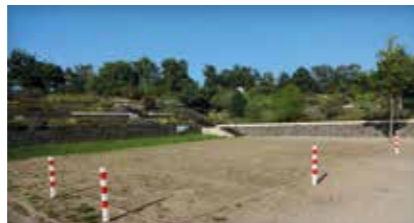
Boule-Platz Eckermannpark 21423 Winsen (Luhe)