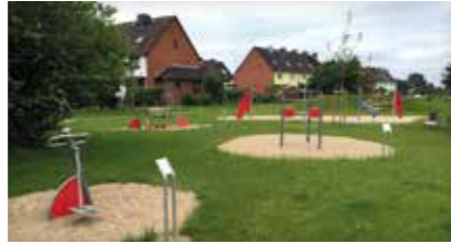
Bewegungs- u. Fitnesspark „Winsener Wiesen“ Astrid-Lindgren-Straße, 21423 Winsen (Luhe)