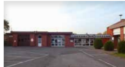
Schützenhaus Borstel Turnhallenweg 6 21423 Winsen (Luhe)