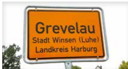
Reithalle Grevelau Grevelau 51 21423 Winsen (Luhe)