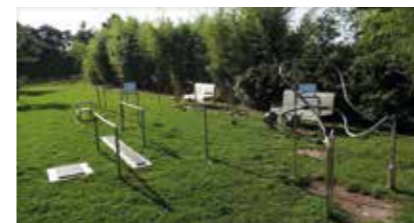
Senioren-Fitness-Geräte Eckermannpark 21423 Winsen (Luhe)