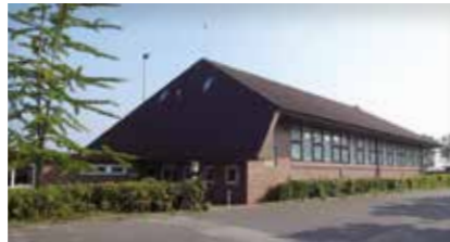
Sporthalle/Sportplatz LaBrönne Kolkhagen 21423 Winsen (Luhe)