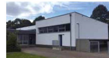
Sporthalle Hanseschule Fuhlentwiete 17 21423 Winsen (Luhe)