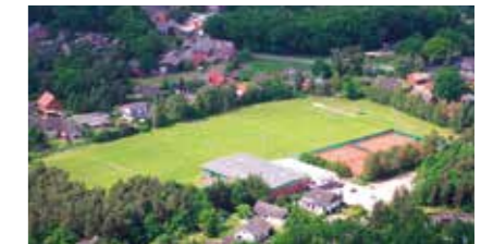
Sporthalle/Sportplatz Luhdorf Höllenberg 2 21423 Winsen (Luhe)