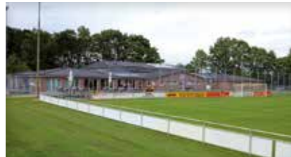
Sportzentrum TSV Winsen Jahnplatz 1 21423 Winsen (Luhe)