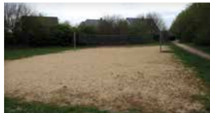
Beachvolleyballplatz „Leipziger Straße“ Leipziger Straße 21423 Winsen (Luhe)