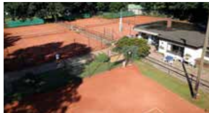
Tennisplatz TV Winsen Luhdorfer Straße 47 21423 Winsen (Luhe)