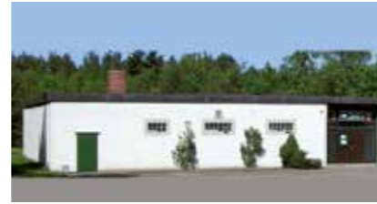
Schützenhaus Pattensen Hirtenbrink 59b 21423 Winsen (Luhe)