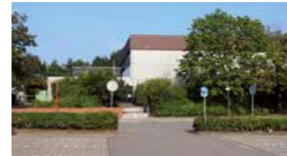
Sporthalle/Sportplatz BBS Bürgerweide 20 21423 Winsen (Luhe)