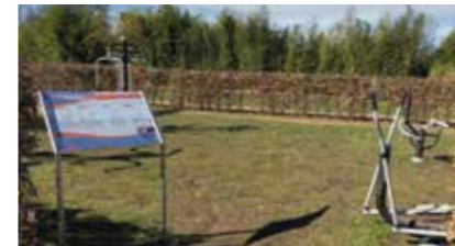
Outdoor-Fitnesspark Eckermannpark 21423 Winsen (Luhe)