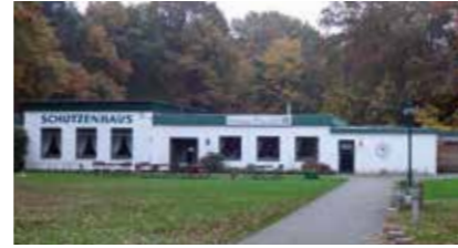
Schützenhaus Winsen Luhdorfer Straße 29c 21423 Winsen (Luhe)