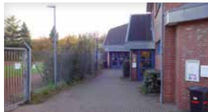
Turnhalle/Sportplatz Stöckte Sportplatzweg 16 21423 Winsen (Luhe)