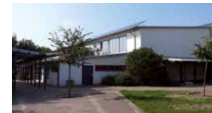
Sporthalle Borsteler Grund Borsteler Grund 30 21423 Winsen (Luhe)