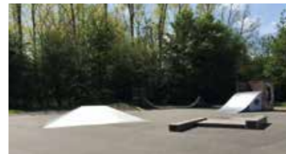
Luhe-Spielpark Skateboardbahn, Fußball-, Volleyball- und Bas- ketballfeld im Luhepark, 21423 Winsen (Luhe)