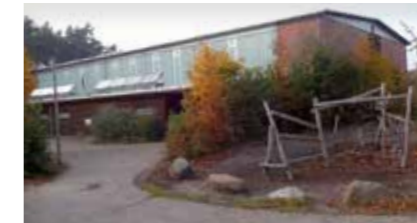
Sporthalle Grundschule Pattensen Rehkamp 45 21423 Winsen (Luhe)